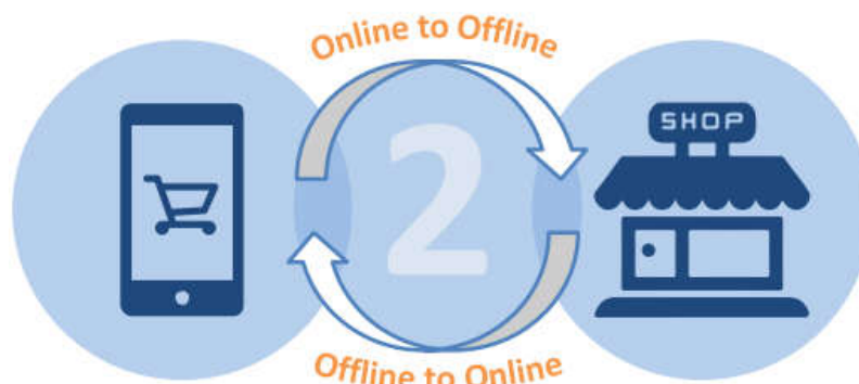
Gambar 2.1 Definisi Model O2O

sehingga dapat dikatakan bahwa O2O merupakan proses seorang konsumen dalam membeli barang dan jasa secara online, kemudian pergi ke toko atau outlet untuk menikmati layanannya (Zhang, 2014). Ringkasnya, definisi konsep model O2O dapat dilihat pada gambar 2.1 dibawah ini (Lo, 2016).