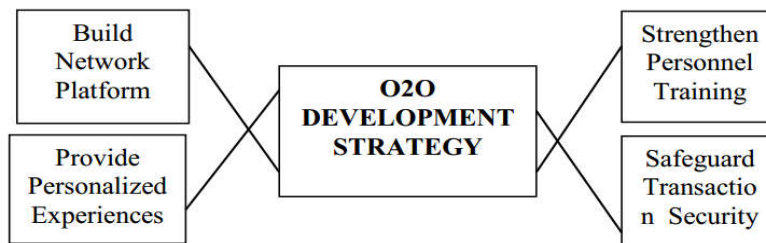
Gambar 3.2 Strategi Pengembangan Model O2O pada UMKM

Model pemasaran O2O disebut juga dengan model integrasi antara online dan offline. Model ini merupakan sebuah kombinasi dari model pembayaran dan jalur distribusi perdagangan yang memungkinkan untuk pembelian secara offline (nyata), seperti contohnya sebuah channel online tidak dapat menyediakan pengalaman nyata dari sebuah restaurant dan hanya digunakan untuk perdagangan barang secara sepihak, sedangkan channel offline tidak dapat menyediakan konsumen tentang informasi lokasi toko ataupun promosi-promosi yang diberikan. Tidak seperti e-commerce tradisional yang lebih mengarah pada model bisnis pasar online dan distribusi logistik, model bisnis O2O lebih mengarah pada pasar online dan pergi ke toko fisik. Oleh sebab itu, diperlukan sebuah kombinasi model yang lengkap yang memungkinkan industri perdagangan seperti UMKM untuk dapat menarik minat konsumen dalam mendapatkan pengalaman berbelanja yang mudah, cepat dan menyenangkan. Adapun model dari pengembangan strategi O2O pada UMKM dapat dilihat pada gambar dibawah ini (Xing & Zhu, 2014):