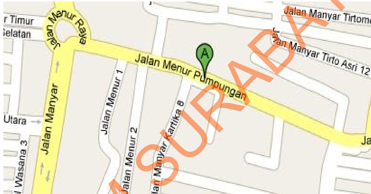
Gambar 2.1. Denah Lokasi