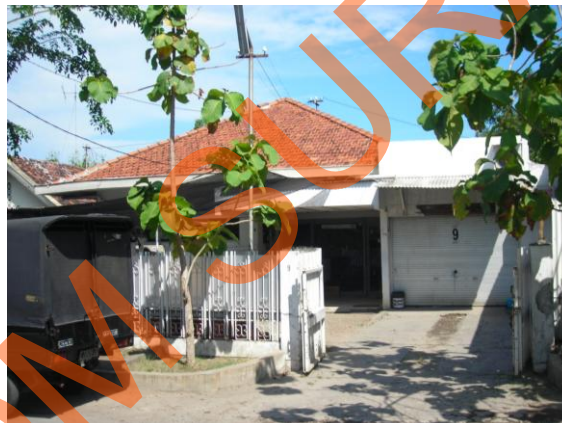
Gambar 2.2 Lokasi Perusahaan

CV. Bayu Mandiri berkantor pusat di Jalan Prambanan No.9, Surabaya, Jawa Timur.