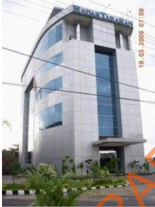
Gambar 2.1 Gedung Surat Kabar Radar Tarakan