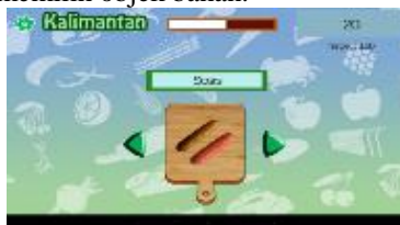
Gambar 9. Tampilan Permainan Pulau Kalimantan

Tampilan game di Pulau Kalimantan lebih sederhana hanya beberapa objek kolom nama dan telenan dibawahnya kemudian button kanan dan kiri berwarna hijau untuk digunakan user waktu memilih objek bahan.