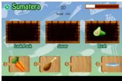
Gambar 8. Tampilan Permainan Pulau Sumatera

Game ini mengajak pengguna untuk bermain mengelompokkan bahan makanan. Desain tampilan game disini adalah beberapa telenan untuk display random objek gambar bahan makanan, tiap keranjang di atasnya yang sudah bertuliskan lauk-pauk, sayur dan buah kemudian terdapat tanda gear di pojok kiri atas untuk pause .