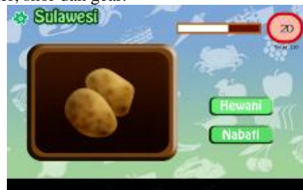
Gambar 11. Tampilan Permainan Pulau Sulawesi

Tampilan game di Pulau Sulawesi merupakan game yang di atur untuk user menebak protein yang ada didalam bahan makanan. Tampilan desainnya hanya terdapat button protein dan button hewani, panel makanan, timer, skor dan gear.