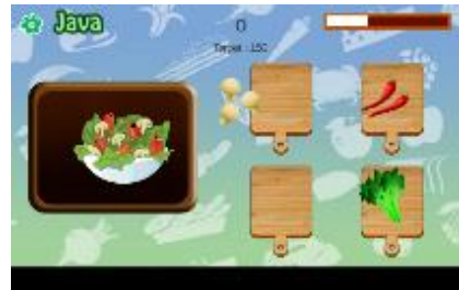
Gambar 10. Tampilan Permainan Pulau Jawa