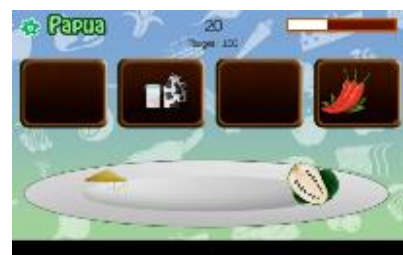
Gambar 12. Tampilan Permainan Pulau Papua

Tampilan game di Pulau Papua mengajak user untuk menentukan bahan makanan dalam piring. Komponen yang ada berupa empat panel, 1 piring besar, timer, skor dan target skor serta ada gear.