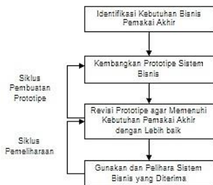
Gambar 1. Proses Metode Pengembangan Prototype