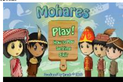
Gambar 6. Tampilan Title Screen Menu

Title Screen Mohares di desain langsung ke dalam beberapa menu seperti ‘play’, ‘how to play’, ‘setting’ dan exit. Disamping elemen telenan dan makanan di tambahkan juga elemen objek karakter 2D sejumlah 5(Lima) dengan menggunakan pakaian baju adat tradisional di Indonesia.