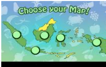
Gambar 7. Tampilan Menu Map