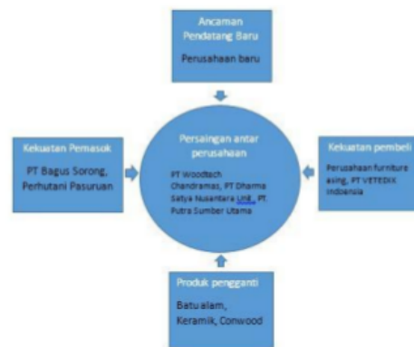
Gambar 2 Hasil analisis Porter's Five Forces PT BMI

Untuk menganalisis situasi lingkungan external yang mungkin di hadapi digunakan teknik analisis eksternal dengan model Porter's five forces . Gambar berikut adalah analisis Porter's five forces pada PT BMI: