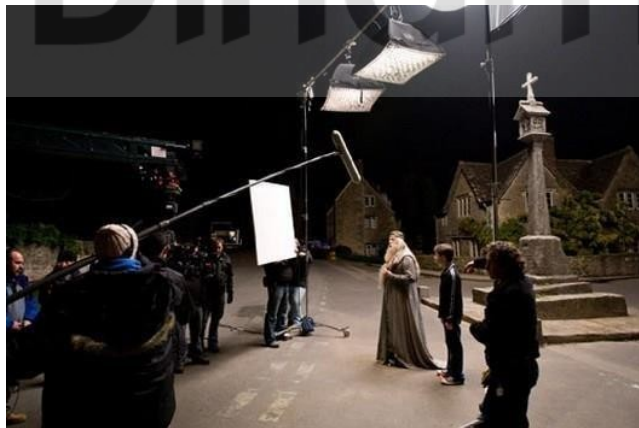
Gambar 3.7 Contoh dari proses syuting berlangsung

Setelah proses pra-produksi, yang di Indonesia umumnya berlangsung 1-3 bulan (tergantung kesulitan), para kru mulai bergerak mengimplementasikan semua yang telah dipersiapkan. Penata artistik membangun set dan menyiapkan properti, penata kamera merekam gambar dengan kameranya, dst. Tugas sutradara adalah memastikan mereka menjalankan fungsi dan peran masing-masing. (Iskandar, 2021).