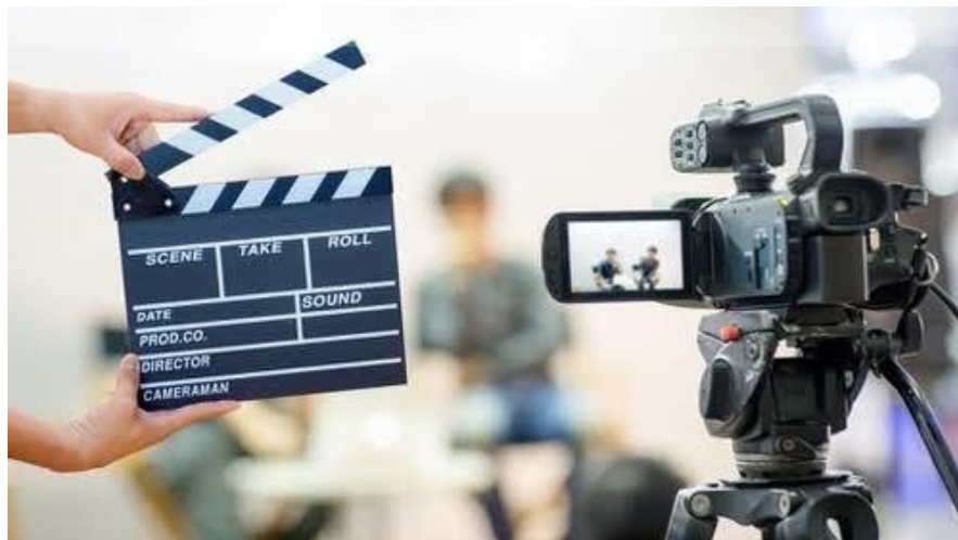
Gambar 3.4 Contoh dari casting film

Dalam pembuatan film casting seringkali terjadi bersamaan dengan penulisan naskah, namun terkadang ada aktor/artis yang sudah menjadi pemikiran ketika menulis naskah. Pemeran kecil/sampingan biasanya dipilihkan penata aktor (Iskandar, 2021).