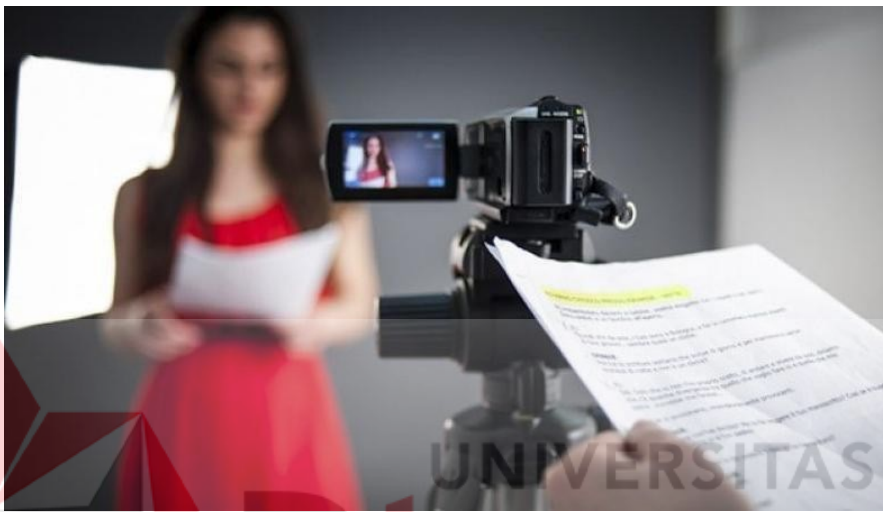
Gambar 3.5 Contoh dari berlatih bersama aktor

Pelatihan aktor dimulai setelah para crew sudah dipilih yang dimulai dengan melakukan pembedahan skenario bersama. Proses pelatihan dan bedah skenario bertujuan agar visi sutradara sama dengan kemampuan akting dan dialog. Pelatihan kemudian dilanjutkan dengan memerankan beberapa adegan selanjutnya pementasan teater (Iskandar, 2021).