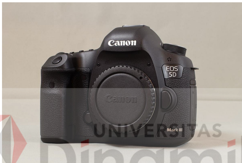
Gambar 4.2 Camera yang digunakan