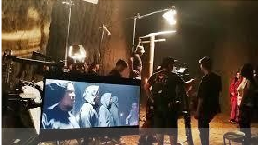
Gambar 3.8 Contoh dari diskusi saat proses syuting berlangsung

Langkah selanjutnya adalah memimpin selama shooting dan membimbing crew melewati segala masalah teknis di lapangan. Permasalahan baik besar atau kecil dan sutradara harus selalu siap menjadi rekan diskusi dan pemecahan masalah (Iskandar, 2021).