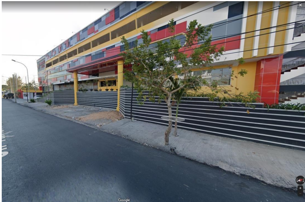
Gambar 2.1 Bagian Depan