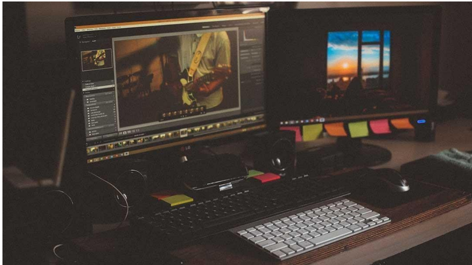
Gambar 3.9 Contoh dari editing film atau vidio