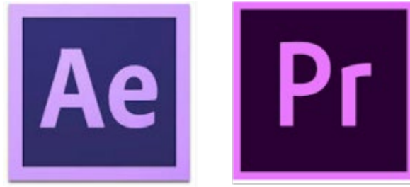
Gambar 4.1 Software yang digunakan