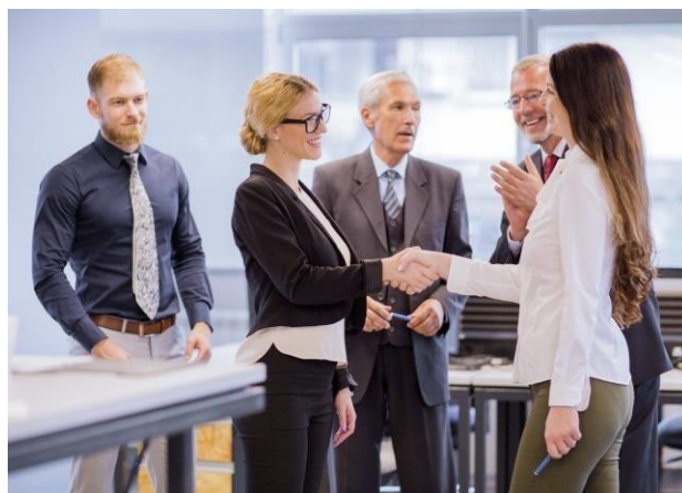
Gambar 3.2 Contoh membentuk tim

Pembentukan tim dilakukan setelah sutradara masuk kedalam project dalam hal ini sutradara memiliki kebebasan untuk membentuk tim dan menunjuk masing masing departament asisten sutradara pertama, penata kamera, penata artistik, penata suara, penata peran, penata rias, penata busana, penata musik, sampai penyunting gambar (Iskandar, 2021).