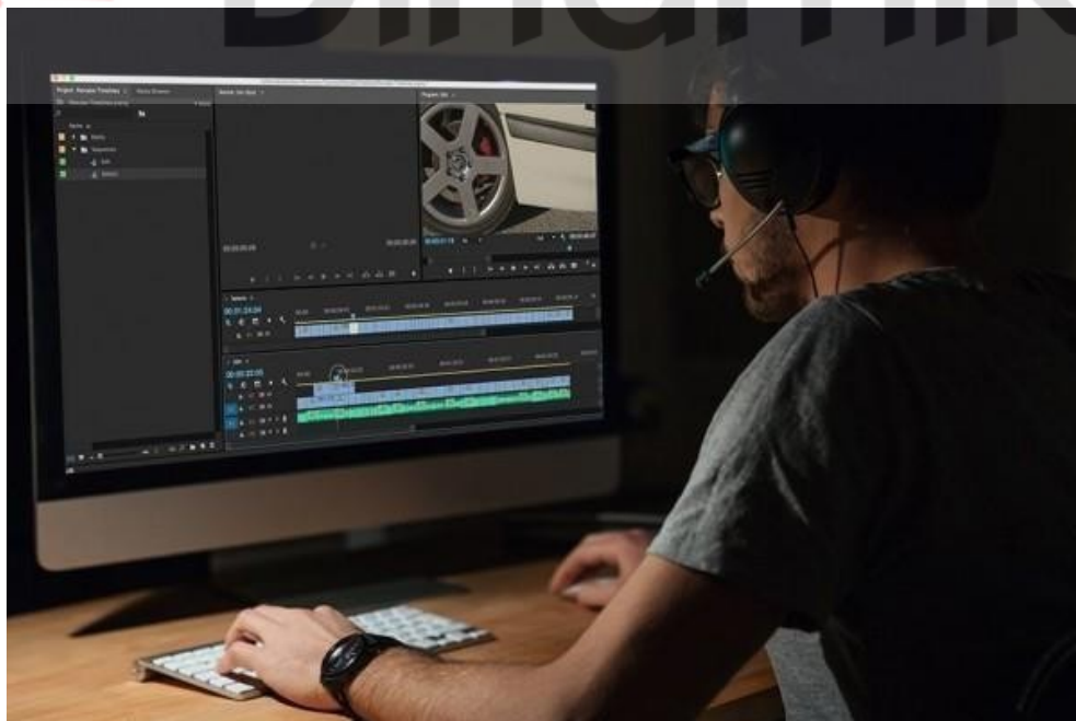
Gambar 3.10 Contoh dari editing film atau vidio

Setelah picture lock , hasil editing akan melalui proses online editing dimana warna dan suara ditambahkan dan di edit . Saat online editing sutradara dan editor bekerjasama untuk menyempurnakan hasil nya dan menambahkan warna serta suara editing sesuai dengan kehendak dan visi sutradara (Iskandar, 2021).