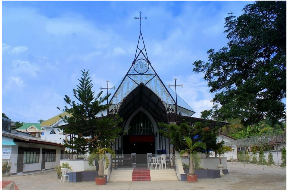
Gambr 4.3 Gereja Kota Kupang

hari Selasa dilakukan berkat nikah yang dilaksanakan dalam gereja kota kupang yang beralamat di l. P. Kemerdekaan III No.23 A, Klp. Lima, Kota Kupang.