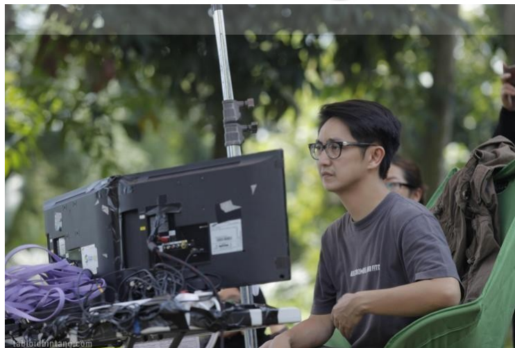
Gambar 3.1 Sutradara memberi arahan saat proses syuting dilapangan.

Seorang sutradara memiliki tugas cukup berat untuk membuat dan memberikan ikatan personal agar dapat memberikan emosi yang mendalam saat menceritakan video perusahaan profil. Pemahaman pengetahuan seorang sutradara juga diuji seperti kemampuan teknis, karakter pemimpin, dan visi.