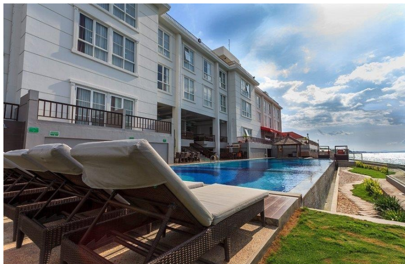
Gambar 4.4 Hotel On The Rock Kupang

Pada Rabu kami melakukan pelaksanaan wedding di Timor raya restaurant dimulai dengan Morning express di on the rock