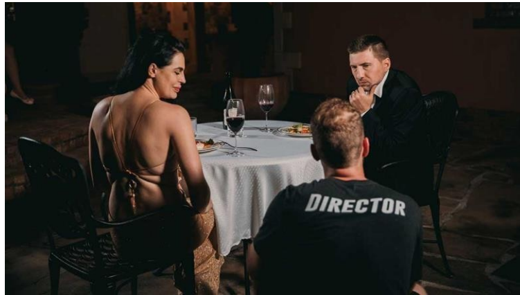
Gambar 3.6 Contoh dari memandu aktor