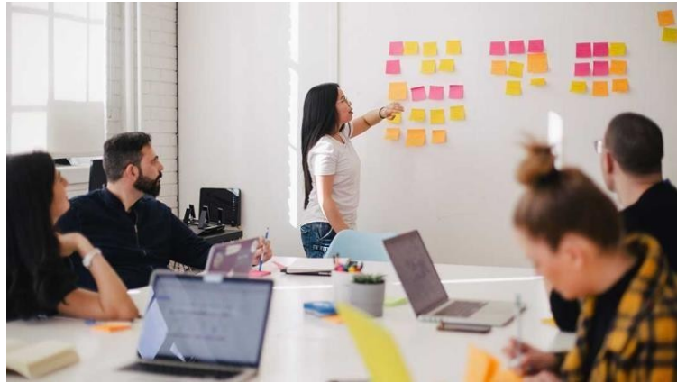
Gambar 3.3 Contoh dari Director's Treatment

Director's treatment merupakan cara direktor/sutradara untuk membentuk dan memberitahukan kepada para tim bagaimana sebuah video seharusnya terbentuk dan element apa saja yang ada didalam bagian tersebut (Iskandar, 2021).