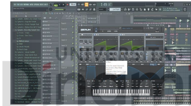
Gambar 4.3 Pemilihan sound design dengan plugin SERUM

Senin 29 Maret, Mixing lagu secara RAW dengan client dengan zoom.