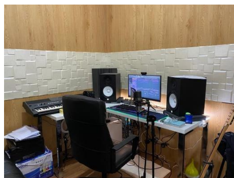
Gambar 4.2 Ruang Kerja PIO RECORDING

Hari pertama kerja praktek diawali dengan introduction dan kontrak kerja dengan pihak PIO RECORDING, dengan diberi arahan dari pemilik PIO RECORDING yaitu Rio Natannael W, setelah itu diberi arahan oleh pak Rio untuk apa saja yang harus saya lakukan setiap harinya, dengan memperkenalkan ruangan ruangan yang ada di studio.