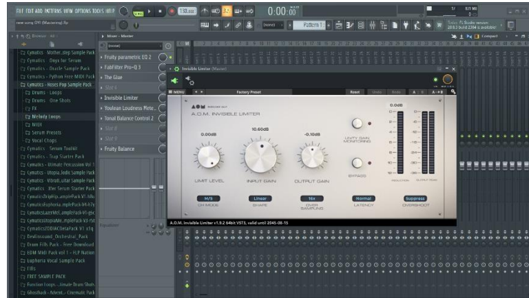
Gambar 4.7 Pemberian karakter suara dengan limiter

Selasa 13 April, Proses mastering dengan melakukan bebebrapa tweak di frekuensi dan pemberian karakter pada lagu