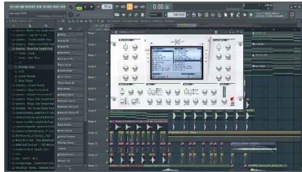
Gambar 4.4 Penambahan instrument organik dengan plugin NEXUS

Senin 5 April, Proses mixing dengan mencoba beberapa plugin dan instrument baru