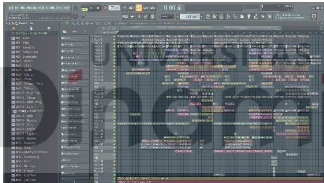
Gambar 4.5 Preview final mix

Kamis, 8 April, Proses tonal balance sebelum memulai mastering