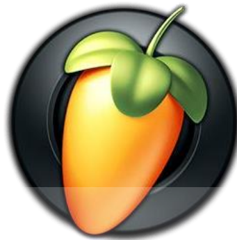
Gambar 4.1 Software yang digunakan

Hal yang juga paling penting dalam proses kegiatan adalah software atau aplikasi yang digunakan untuk menunjang pekerjaan dan kegiatan selama Kerja Praktik, dan software atau aplikasi utama yang digunakan yaitu FL Studio 20 seperti pada gambar 4.1 berikut.