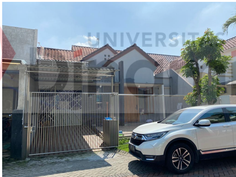
Gambar 2.1 Letak Lokasi PIO RECORDING