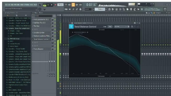
Gambar 4.6 Tonal balance sebelum mastering

Kamis, 8 April, Proses tonal balance sebelum memulai mastering