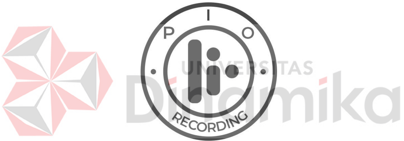
Gambar 2.1 Logo PIO RECORDING

PIO RECORDING beralamat di Taman puspa raya c5 11, Surabaya. Gambar 2.2 dan gambar 2.3 merupakan tempat PIO RECORDING. Berikut ini adalah logo PIO RECORDING.