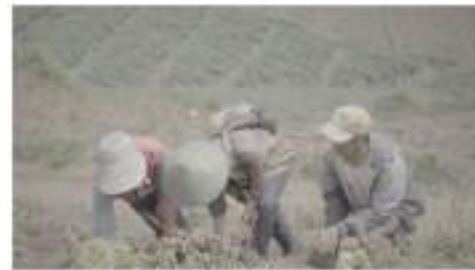
Gambar 1. Safari Agro

Dari hasil observasi dan wawancara yang telah dilakukan, Desa Ngados memiliki akses jalan yang baik bisa ditempuh dengan kendaraan roda dua dan empat, selama perjalanan menuju ke Desa Ngados, pengunjung akan melewati lading dan pertanian masyarakat dengan pemandangan yang indah. Potensi alam yang terdapat pada Desa Ngados ini adalah safari agro, bukit khayangan, bukit sunset, bukit galaxy, air terjun 5 menit. Masyarakat memberi nama Air terjun 5 menit karena letak air terjun ini hanya berjarak lima menit dari desa.