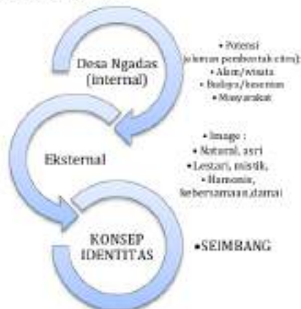
Gambar 6. Mind mapping image Desa Ngadas

Berdasarkan hasil dari analisa mind mapping, maka aset budaya yang terdapat pada Desa Ngadas memiliki potensi yang sangat besar. Kebudayaan yang lahir dan tetap dilestarikan pada Desa Ngadas memberikan keunggulan yang dapat diangkat sebagai citra yang akan membangun branding dari Desa Ngadas . Masyarakat Desa Ngadas menjunjung tinggi perbedaan yang mengadirkan sebuah kesatuan, hal ini tampak pada masyarakat Desa Ngadas memeluk agama Budha sebanyak 50% dari total jumlah penduduk. Sisanya, sejumlah 30% memeluk agama Islam dan 20% agama Hindu. Bahkan, terdapat juga dalam satu keluarga memeluk tiga agama yang berbeda. Masyarakat Desa Ngadas masih memegang teguh pada praktik ritual dan upacara kuno, hal ini diyakini dapat membuat kehidupan masyarakat menjadi teratur dan tenang.