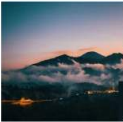
Gambar 3. Bukit sunset

untuk menikmati keindahan matahari terbit.