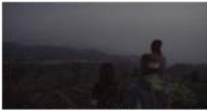
Gambar 4. Bukit khayangan

Bukit ini terletak pada puncak sisi selatan Ngadas yang biasa disebut bantengan. Dari tempat ini pengunjung bisa melihat keindahan matahari tenggelam dengan panorama Desa Ngadas yang terlihat dari atas.