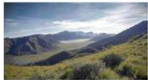
Gambar 2. Bukit khayangan

Gambar 1 adalah safari agro yang merupakan salah satu potensi alam yang dimiliki Desa Ngados. Wisata ini termasuk wisata edukasi untuk bercocok tanam, terletak pada wilayah utara lading pertanian desa dan dikelilingi perbukitan lading masyarakat Desa Ngados.