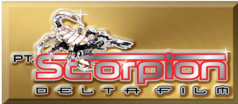
Gambar 2.2 Logo Perusahaan PT. Scorpion Delta Film