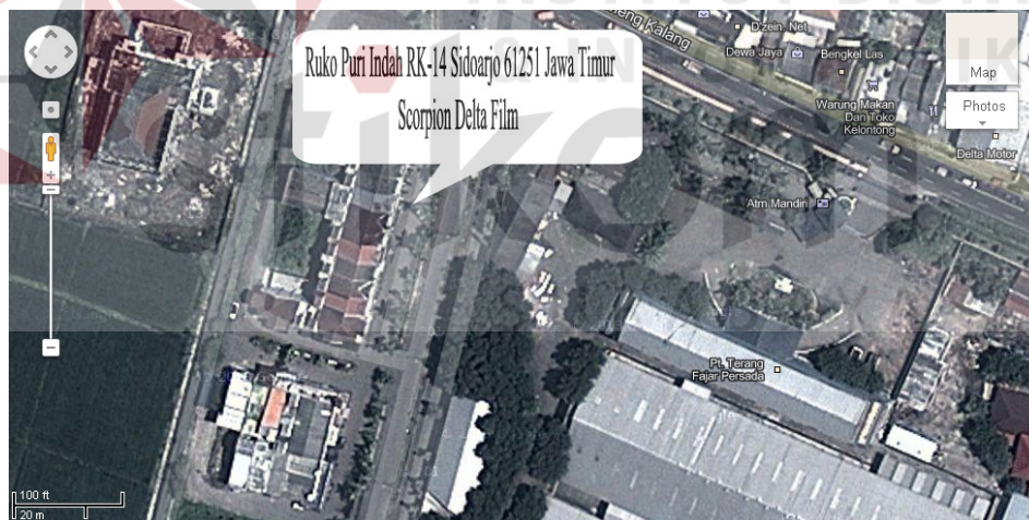
Gambar 2.1 Lokasi Perusahaan

Telepon : (031) 8288888, e-mail : Scorpiondeltafilm@yahoo.com