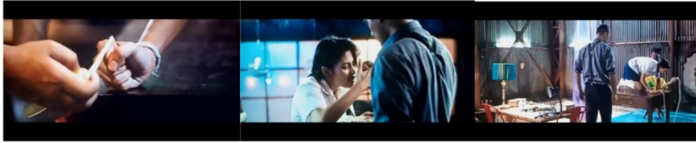
Gambar 2.5 Scene Film 27 Steps Of May

Ikon: May Berusaha Mereka-adekankan kejadian trauma yang ia alami dengan meminta bantuan kepada pesulap.