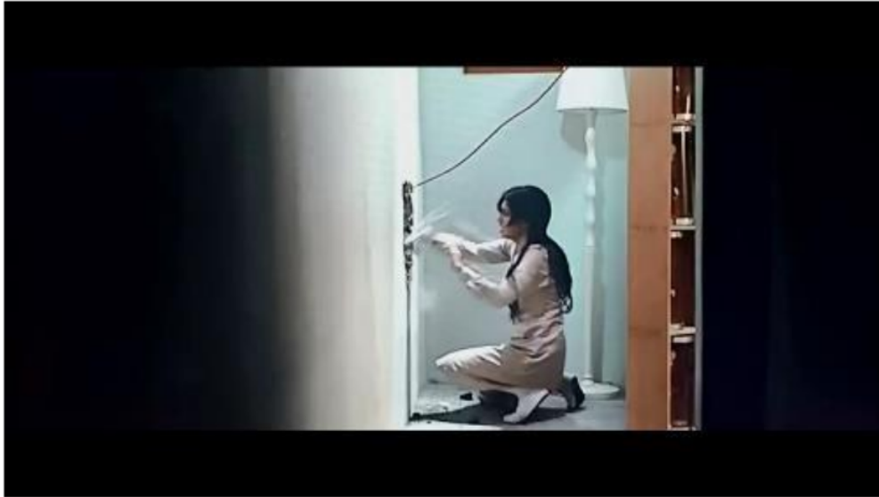
Gambar 2.3 Scene Film 27 Steps Of May

Ikon: May melawan ketakutannya dengan keluar dari zonanya di balik tembok kamarnya.