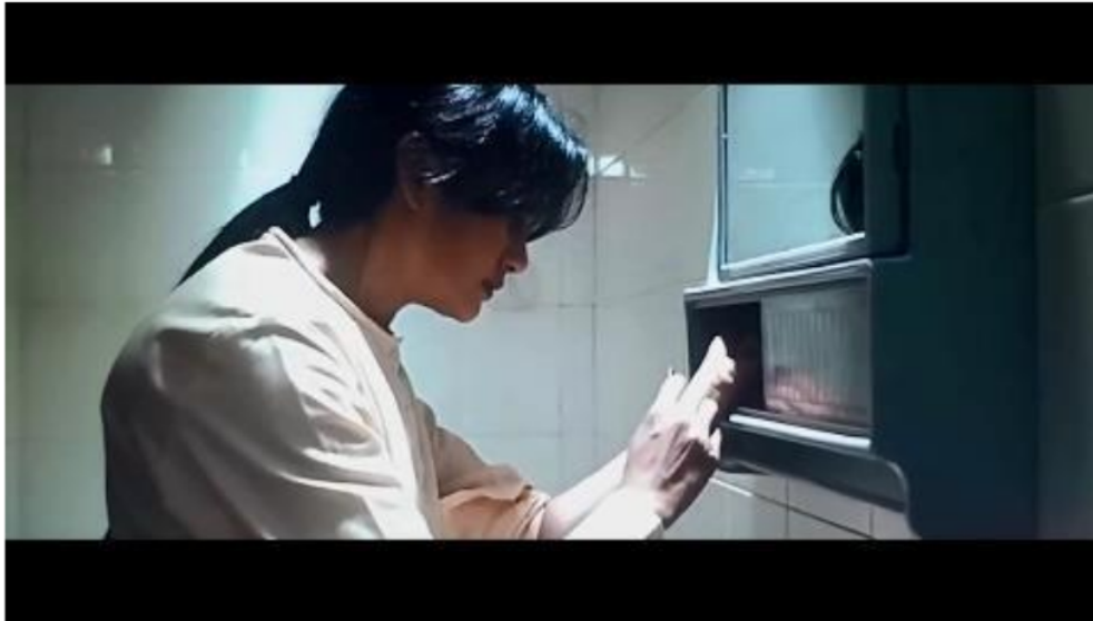
Gambar 2.2 Scene Film 27 Steps Of May

Ikon: May menunjukkan ketertarikan dan rasa ingin mencoba hal baru, ia bersedia berinteraksi secara fisik dengan sosok pesulap, namun hal ini malah memicu ingatan May.