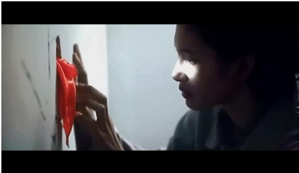
Gambar 2.1 Scene Film 27 Steps Of May

Ikon: May yang mulai tertarik dengan hal baru.