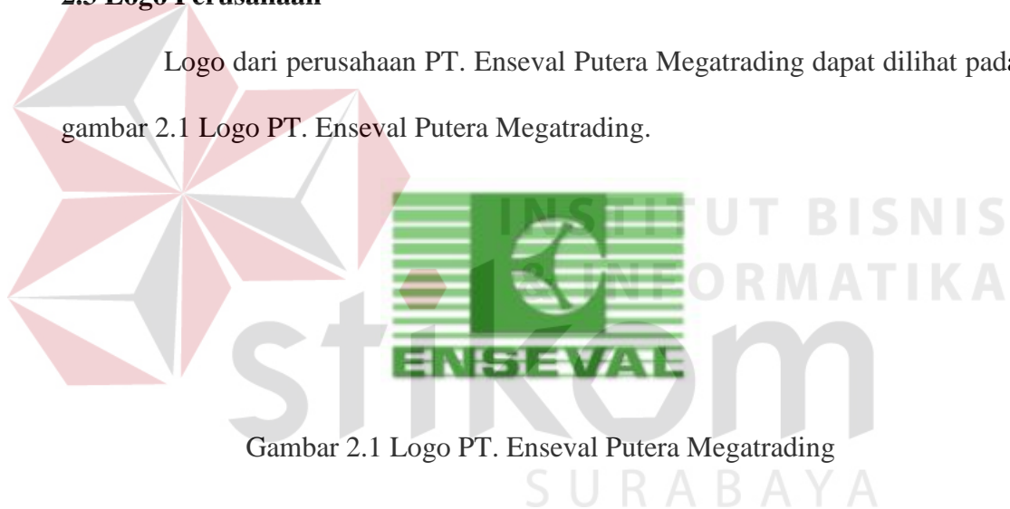
Gambar 2.1 Logo PT. Enseval Putera Megatrading

Logo dari perusahaan PT. Enseval Putera Megatrading dapat dilihat pada gambar 2.1 Logo PT. Enseval Putera Megatrading.