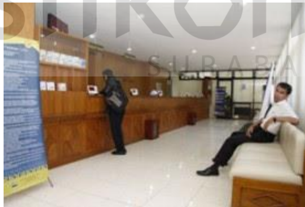
Gambar 2.2 Proses pelayanan perizinan usaha