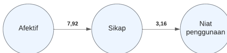
Gambar 3. Hasil Uji Path Coefficients pada GeSCA

Hasil uji hipotesis berdasarkan hasil path coefficients pada aplikasi GeSCA, menunjukkan bahwa variabel afektif berpengaruh positif dan signifikan terhadap sikap, dan variabel sikap juga berpengaruh positif dan signifikan terhadap niat penggunaan. Menurut penelitian Hult et.al , hipotesis diterima apabila memiliki nilai t-statistics > 1.96 [15]. Hal ini dibuktikan dengan critical value 1.96 pada taraf signifikansi 5%, sehingga nilai t-statistics \geq 1.96 . Gambar 3 memperlihatkan nilai t-statistics pada masing-masing hubungan variabel.