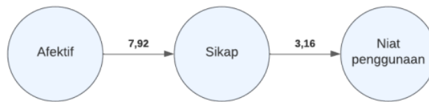
Gambar 3. Hasil Uji Path Coefficients pada GeSCA

Hasil uji hipotesis berdasarkan hasil path coefficients pada aplikasi GeSCA, menunjukkan bahwa variabel afektif berpengaruh positif dan signifikan terhadap sikap, dan variabel sikap juga berpengaruh positif dan signifikan terhadap niat penggunaan. Menurut penelitian Hult et.al , hipotesis diterima apabila memiliki nilai t-statistics > 1.96 [15]. Hal ini dibuktikan dengan critical value 1.96 pada taraf signifikansi 5%, sehingga nilai t-statistics \geq 1.96 . Gambar 3 memperlihatkan nilai t-statistics pada masing-masing hubungan variabel.