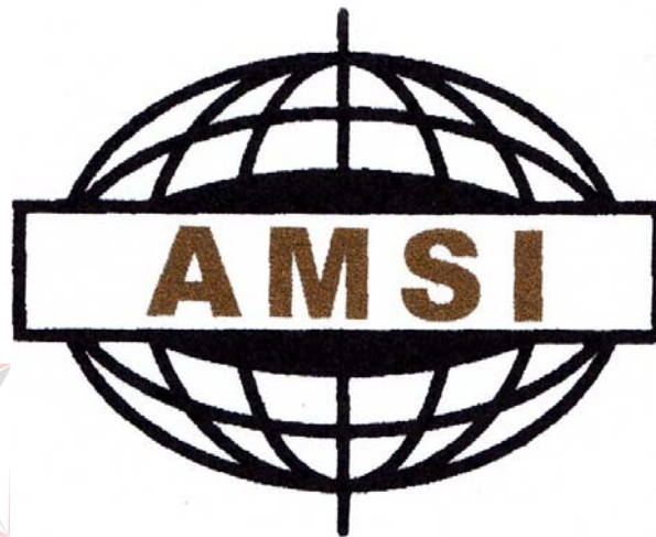
Gambar 1.1 Logo PT. Alindo Makmur Sentosa Internasional

Pada Gambar 1.1 menjelaskan bahwa PT. Alindo Makmur Sentosa Internasional memiliki logo resmi sebagai lambang dari perusahaan tersebut. Berikut ini logo dari PT. Alindo Makmur Sentosa Internasional, yaitu: