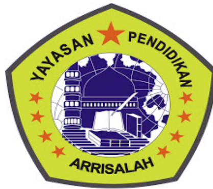
Gambar 2.1 Logo SMA Ar-Risalah