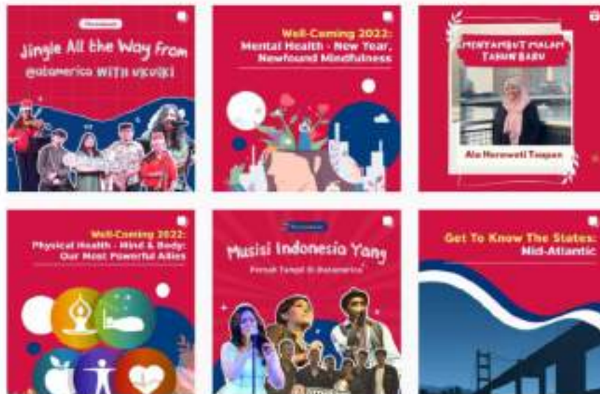
Gambar 4. Unggahan @america di Instagram terkait diplomasi publik Muslim Indonesia