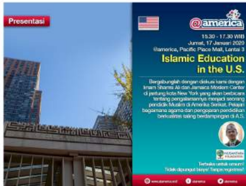
Gambar 2. Presentasi dengan Tema Edukasi Islam di Amerika Serikat

Gambar 2 memberikan ilustrasi kepada khalayak bahwa Amerika Serikat mendukung komunitas Muslim dari segi edukasi berdasarkan deskripsi dalam unggahan. Komposisi warna dalam gambar juga menempuh pencampuran unsur bendera Amerika Serikat, dengan dominasi warna merah dan biru, dengan unsur Islam dengan dominasi warna hijau dan kuning (Suglyanto, 2021). Unsur Islami dalam gambar tersebut kemudian dikombinasikan menjadi gradien warna biru dengan biru kehijauan dalam badan teks deskripsi presentasi dan warna kuning dijadikan sebagai warna teks dalam tema presentasi.