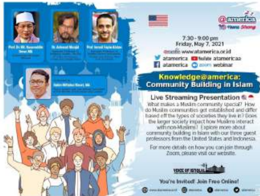
Gambar 3. Presentasi Digital @america Community Building in Islam

sebuah negara yang memusuhi umat Islam di dunia sebagaimana wacana-wacana yang beredar sebelumnya.