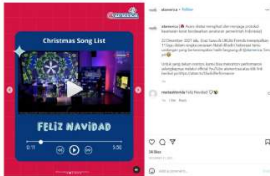
Gambar 5. Publikasi Lampiran Acara @america terkait Perayaan Natal

Gambar 5 kembali mencerminkan publisitas positif Amerika Serikat yang dituangkan melalui cagar kebudayaan @america. Deskripsi dalam unggahan yang menceritakan narasi sejumlah figur publik Indonesia yang berpartisipasi dalam perayaan Natal di @america telah menerima 34 respon positif dari masyarakat digital (Lumampauw et al., 2020). Publikasi tersebut juga mencerminkan penerimaan Amerika Serikat yang menerima agama lain dalam mengikuti perayaan Natal dan menghapus prasangka negatif dari komunitas Muslim di Indonesia sebagaimana wacana yang berkembang sebelumnya.