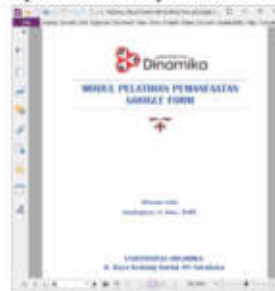
Gambar 2 Modul pelatihan Google Form

smartphone yang dimiliki dan mengurangi penggunaan kertas. Gambar 2 berikut adalah tampilan modul pelatihan.