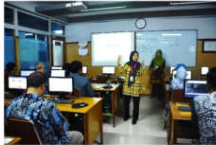
Gambar 4 Suasana pelatihan

peserta lupa akan password email Google yang mereka miliki. Syarat utama dari pelatihan ini adalah semua peserta sudah memiliki email pada layanan Google Mail . Persyaratan ini telah disampaikan kepada ketua MGBK sebelum pelatihan diselenggarakan.