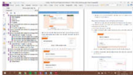
Gambar 3 Materi dalam modul

Modul pelatihan yang disiapkan membahas tentang empat hal yaitu, 1) desain dan tampilan, 2) pembuatan form, 3) pengolahan hasil, dan 4) membaca hasil. Tampilan dari materi yang terdapat dalam modul dapat dilihat pada gambar 3 berikut.