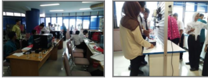
Gambar 2. Pelatihan di Hari Ke-2

3. Hari ketiga: Materi: membaca status output, operand flag, Latch dan Lock, diagram notasi, program sekuensial, aplikasi sekuensial pada peralatan input [8]. Aktivitas peserta: membuat program untuk membaca status output dan membuatnya sebagai bagian dari kondisi, membuat program untuk memanfaatkan flag sebagai jembatan antara input dan output, praktik Latch dan Lock sederhana, seperti pada Gambar 3 [9]. Hasil: seluruh kelompok mampu menyajikan hasil aktivitas 1 s/d 3.