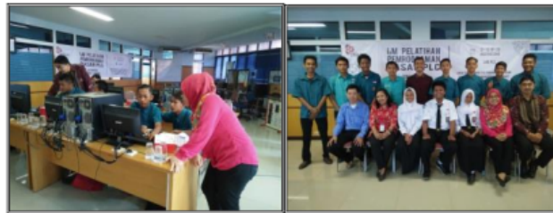
Gambar 5. Pelatihan di Hari Ke-4