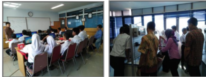
Gambar 1. Pelatihan di Hari Ke-1

1. Hari pertama.: Materi: Mengenal catu daya, peralatan sensor dan aktuator, serta cara merakitnya, logika NOT, AND, OR dalam rangkaian listrik (tanpa PLC) yang melibatkan catu daya, tombol, dan lampu. Aktivitas peserta: merangkai catu daya, tombol, dan lampu untuk membuktikan 4 rangkaian. Hasil: seluruh kelompok mampu membuat semua logika rangkaian listrik pada perangkat pelatihan yang disediakan, dengan waktu yang bervariasi antar kelompok.