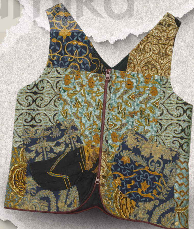
*dalam bentuk Vest (Rompi)