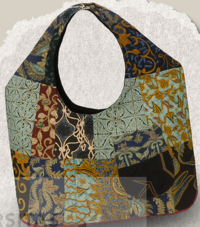
*dalam bentuk Tote Bag