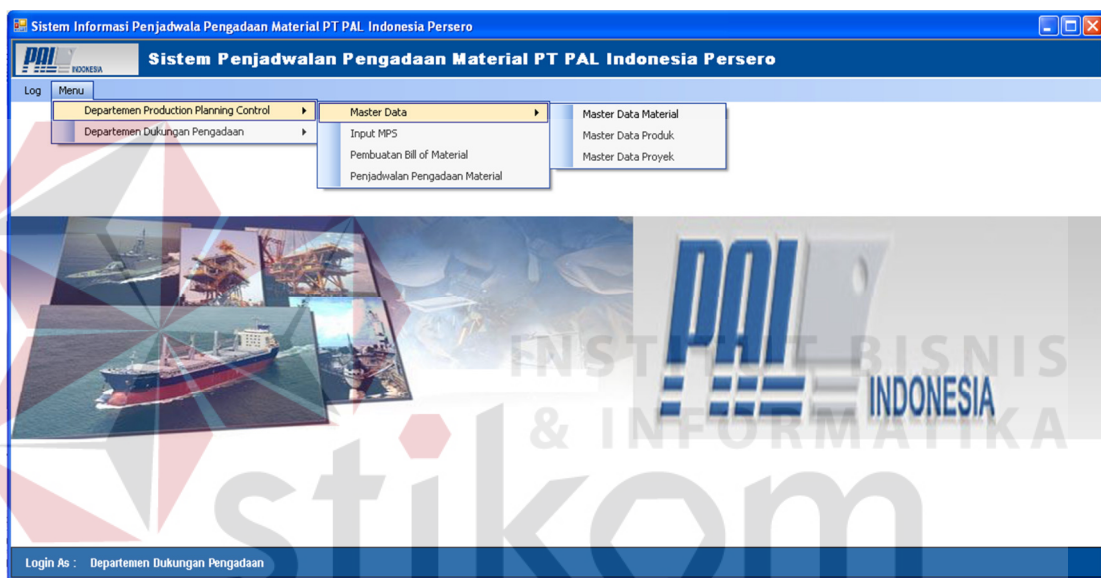
Gambar 4.2. Form Utama

Material, dan master BoM, serta Pembuatan Bill of Material (Untuk Proyek) dan Input Data MPS, Sedangkan Departemen Dukungan Pengadaan mendapat hak akses update data stock material dan leadtime pembelian, serta form penjadwalan pengadaan material. Selain dua departemen ini, user admin mempunyai hak untuk mengakses semua menu pada form utama ini. Pada bagian kiri bawah terdapat pula label yang berguna untuk menampilkan nama departemen yang sedang login.