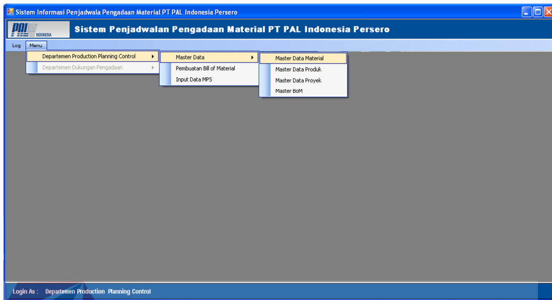
Gambar 4.18 Form Utama 1

Pada Gambar 4.18 Login Sebagai: Departemen Production & Planning Control berhak untuk mengakses menu-menu master seperti master material, master produk, dan master proyek. Tetapi departemen tersebut tidak dapat mengakses menu-menu lain yang diperuntukan Departemen Dukungan Pengadaan.