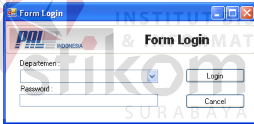
Gambar 4.1 Form login

Form login pada gambar 4.1 ini digunakan untuk mengetahui pengguna yang akan menggunakan aplikasi ini. Dengan memilih departemen pada combobox departemen dan menginputkan password maka sistem akan mengetahui departemen apa yang akan menggunakan aplikasi ini sehingga sistem dapat menentukan hak aksesnya. Pada bagian bawah terdapat 2 tombol yaitu tombol Login dan tombol cancel. Tombol Login digunakan untuk mengecek apakah data login yang diinputkan benar atau tidak. Apabila data login benar, status data login akan diketahui dan akan mempengaruhi hak akses. Tombol Batal digunakan untuk merestart combobox departemen dan password dan membatalkan proses login.