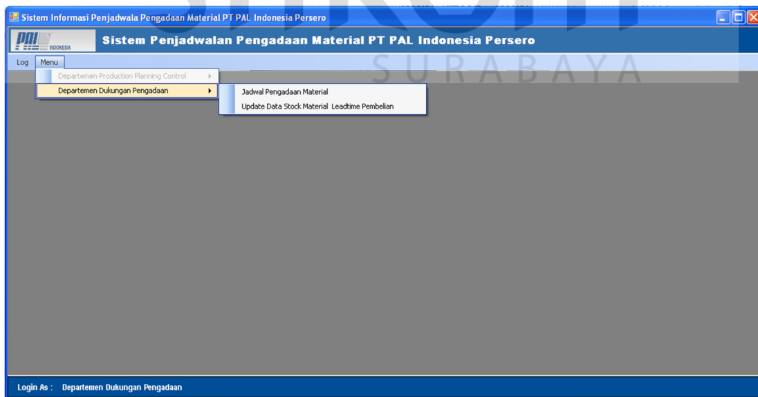
Gambar 4.19 Form Utama 2

Pada Gambar 4.18 Login Sebagai: Departemen Production & Planning Control berhak untuk mengakses menu-menu master seperti master material, master produk, dan master proyek. Tetapi departemen tersebut tidak dapat mengakses menu-menu lain yang diperuntukan Departemen Dukungan Pengadaan.