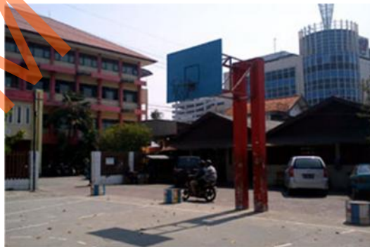
Gambar 2.8 Lapangan Basket SMA Kemala Bhayangkari 1 Surabaya

SMA Kemala Bhayangkari 1 Surabaya menyediakan lapangan basket sebagai tempat pengembangan diri bagi siswa yang gemar bermain basket dan menunjang proses latihan bagi ekskul basket yang ada. Dalam pengembangan untuk olah raga basket memberika fasilitas-fasilitas dibutuhkan yang berupa bola