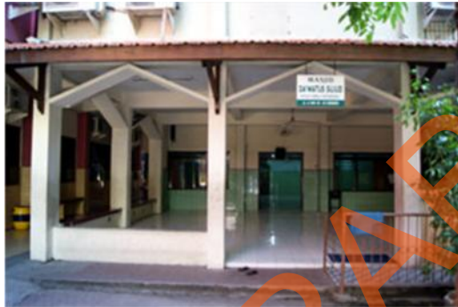
Gambar 2.5 Masjid SMA Kemala Bhayangkari 1 Surabaya

Masjid di SMA Kemala Bhayangkari 1 Surabaya selalu terjaga kebersihannya pada setiap harinya. Dapat menambah kenyamanan umat islam yang menjalankan ibadahnya di masjid ini. Sehingga warga sekolah dapat melakukan ibadahnya dengan khusuq .