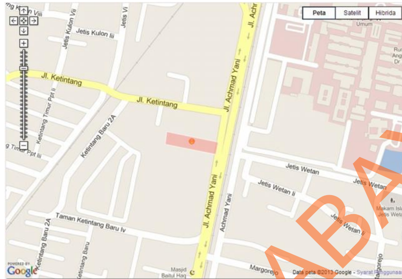
Gambar 2.2 Denah lokasi SMA Kemala Bhayangkari 1 Surabaya

SMA Kemala Bhayangkari 1 Surabaya terletak diantara Jl.Achmad Yani dan Jl.Ketintang yang tepat pertigaan dua sisi jalan. Bersebelahan dengan mall Royal Plaza dan juga bersebelahan dengan distributor TVS. Dapat dilihat pada gambar 2.2 telah ditandai lingkaran merah pada untuk lokasi SMA Kemala Bhayangkari 1 Surabaya.