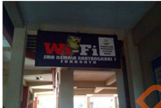
Gambar 2.13 WiFi Area pada SMA Kemala Bhayangkari 1 Surabaya

SMA Kemala Bhayangkari 1 Surabaya saat ini menyediakan Fasilitas WiFi. Area yang berguna untuk menggali wawasan yang ada pada dunia maya (internet) sehingga dapat menunjang proses pembelajaran yang ada.