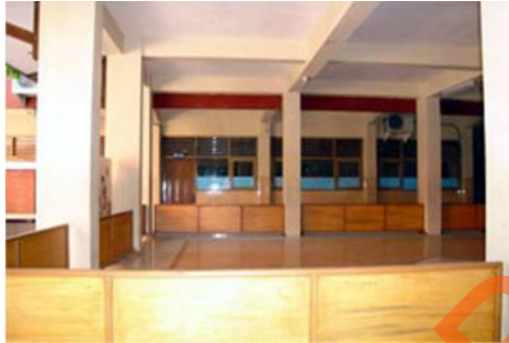
Gambar 2.9 Joglo pada SMA Kemala Bhayangkari 1 Surabaya

SMA Kemala Bhayangkari 1 Surabaya menyediakan sebuah Joglo sebagai tempat untuk acara kecil yang di adakan oleh pihak sekolah maupun pihak yang terkait. Fungsi joglo juga dapat digunakan siswa untuk tempat belajar bersama dalam mendukung pembelajaran.