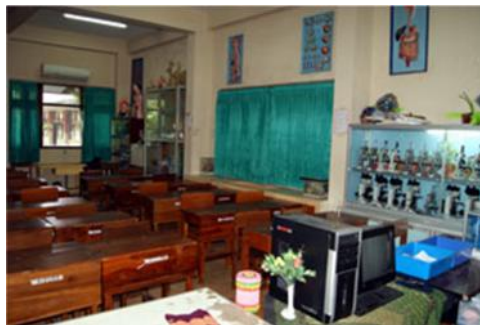
Gambar 2.4 Lab. IPA SMA Kemala Bhayangkari 1 Surabaya