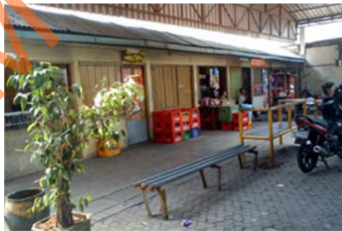
Gambar 2.10 Kantin Pada SMA Kemala Bhayangkari 1 Surabaya

Kantin di SMA Kemala Bhayangkari 1 Surabaya menyediakan bermacam - macam makanan, kue dan minuman yang terjaga kebersihannya demi kesehatan murid – murid beserta staff yang ada.