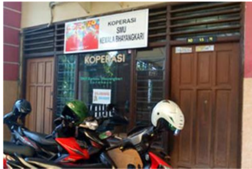
Gambar 2.11 Koperasi dan Wartel pada SMA Kemala Bhayangkari 1 Surabaya

SMA Kemala Bhayangkari 1 Surabaya kini telah memiliki Koperasi dan wartel yang berguna untuk keperluan siswa maupun staff yang ada. Dalam koperasi terdapat 1 mesin fotocopy 1 unit komputer dan juga 3 wartel. Koperasi tersebut juga menjual beberapa aneka makanan dan juga kebutuhan sekolah lainnya.