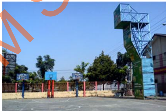
Gambar 2.12 Panjat Tebing pada SMA Kemala Bhayangkari 1 Surabaya

SMA Kemala Bhayangkari 1 Surabaya menyediakan fasilitas Panjat Tebing untuk keperluan ekskul yang menyukai olah raga menantang. Dengan itu sekolah mendukung kegiatan untuk perkembangan siswa dengan memfasilitasi dalam melakukan olah raga diminati. Dalam olah raga tersebut sekolah tetep