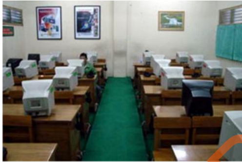
Gambar 2.7 Lab. Komputer SMA Kemala Bhayangkari 1 Surabaya

Pada SMA Kemala Bhayangkari 1 Surabaya tersedia ruang Lab. Komputer untuk menunjang proses pembelajaran yang ada. Terdapat satu ruangan yang memiliki 24 komputer dengan didukungnya fasilitas-fasilitas dalam ruangan. Sehingga membuat siswa belajar dengan fokus dalam pembelajaran.