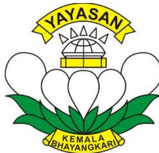
Gambar 2.1 Logo SMA Kemala Bhayangkari 1 Surabaya