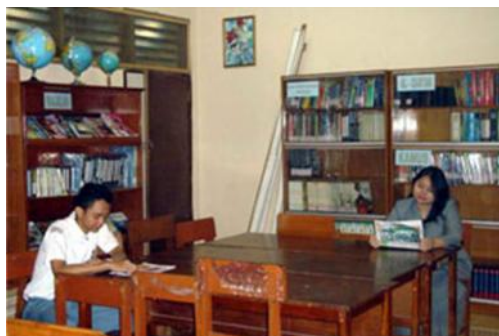
Gambar 2.6 Suasana Perpustakaan SMA Kemala Bhayangkari 1 Surabaya

SMA Kemala Bhayangkari 1 Surabaya kini didukung dengan fasilitas berupa perpustakaan. Dengan koleksi - koleksi buku yang dipakai dalam proses