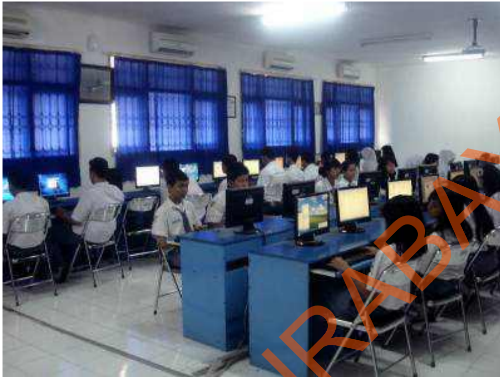
Gambar 2.4 Lab. Komputer SMA Hang Tuah 2 Sidoarjo

Lab. Komputer di SMA Hang Tuah 2 Sidoarjo yang berukuran luas. Ditunjang dengan sirkulasi udara yang baik, kebersihan yang terjaga, serta didukung oleh fasilitas – fasilitas yang memadai misalnya Air Conditioner (AC), 1 Set PC. Guna untuk membuat kenyamanan belajar para siswa.