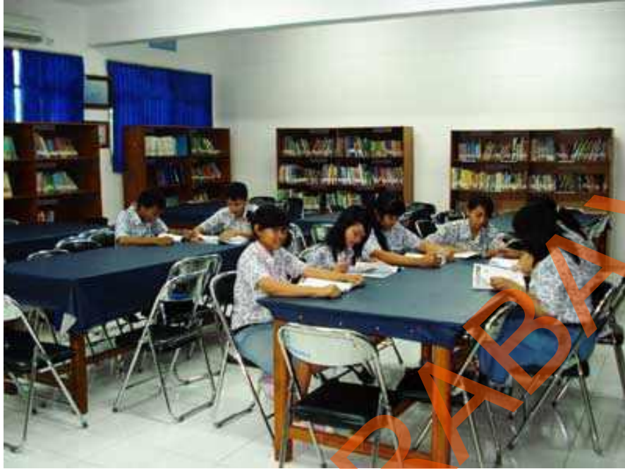
Gambar 2.5 Suasana Perpustakaan SMA Hang Tuah 2 Sidoarjo

SMA Hang Tuah 2 Sidoarjo kini didukung dengan fasilitas berupa perpustakaan. Dengan koleksi - koleksi buku yang dipakai dalam proses belajar mengajar dan juga koleksi buku import sebagai bahan referensi. Dan juga menambah wawasan pengetahuan non-akademi .