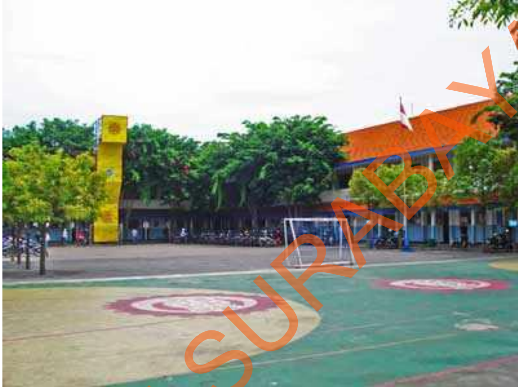
Gambar 2.7 Lapangan Olahraga

SMA Hang Tuah 2 Sidoarjo menyediakan lapangan Olahraga sebagai tempat pengembangan diri bagi siswa yang gemar bermain basket, sepak bola, wall climbing, bola volley dan menunjang proses latihan bagi ekskul yang ada.