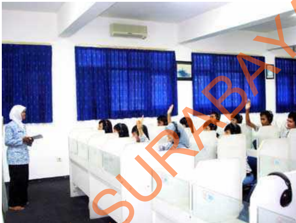
Gambar 2.6 Lab. Bahasa SMA Hang Tuah 2 Sidoarjo

Pada SMA Hang Tuah 2 Sidoarjo tersedia ruang Lab. Bahasa untuk menunjang proses pembelajaran yang ada. Dengan didukungnya fasilitas-fasilitas dalam ruangan. Sehingga membuat siswa belajar dengan fokus dalam pembelajaran.