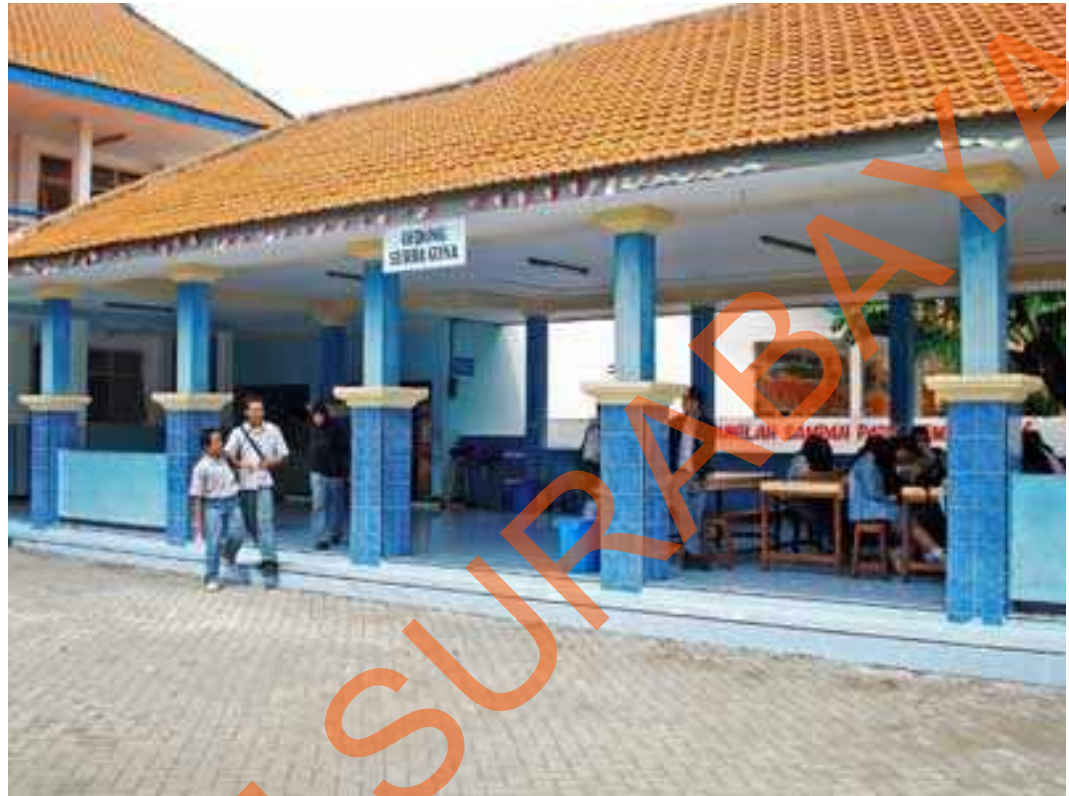
Gambar 2.9 Kantin SMA Hang Tuah 2 Sidoarjo

Kantin di SMA Hang Tuah 2 Sidoarjo menyediakan bermacam - macam makanan, kue dan minuman yang terjaga kebersihannya demi kesehatan murid – murid beserta staf yang ada.