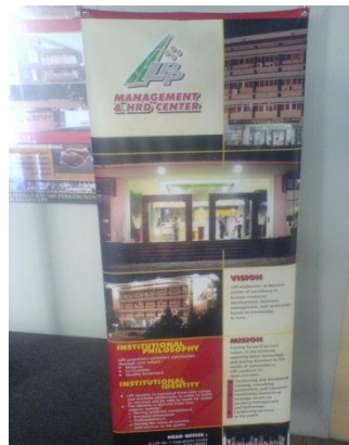
Standing Banner LPP