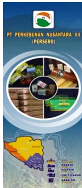
Print poster PTPN VII