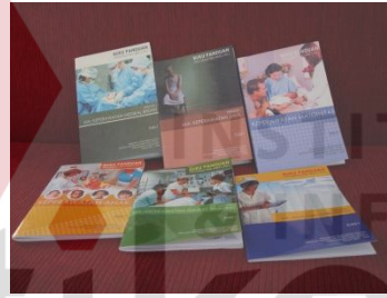
Cetak buku panduan