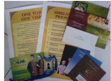
Undangan – poster – ID card