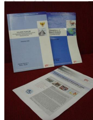
Cetak buku - newsletter