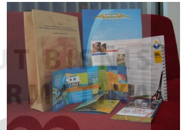
Cetak aneka media promosi (leaflet, booklet, map, tas kertas)