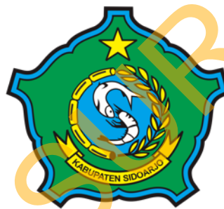
Gambar 2.1 Logo Pemerintah Kabupaten Sidoarjo

Logo dari Pemerintah Kabupaten Sidoarjo dapat dilihat pada Gambar 2.1